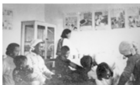
1947年暑假，什坊院保健院门诊给老乡看病的候诊室

参加什坊院保健院的师生都是一群有理想、有抱负的热血青年。参加乡村卫生工作，他们不仅造福了一方百姓，也更加清醒深刻地认识了旧中国的社会现状，认清了中国的未来和希望在哪里。