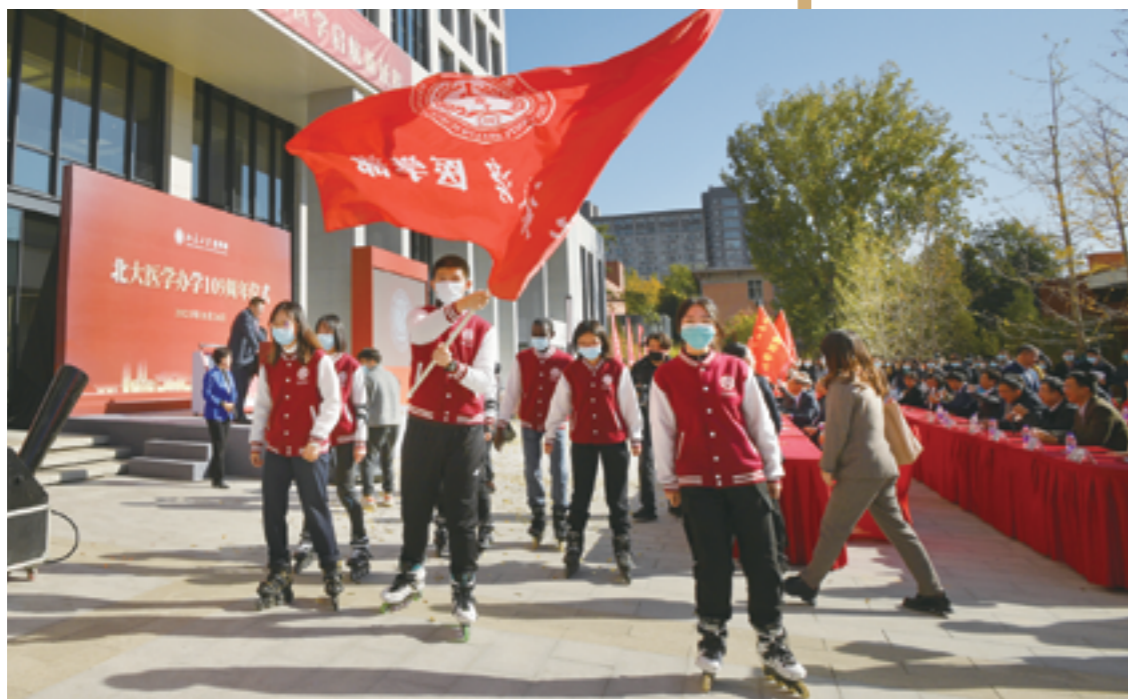
庆祝北大医学办学109周年校园健康大步走