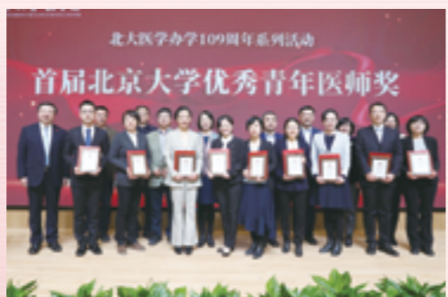
领导和嘉宾为优秀青年医师奖获得者颁奖