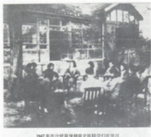
1947年在什坊院保健院北医附院学习