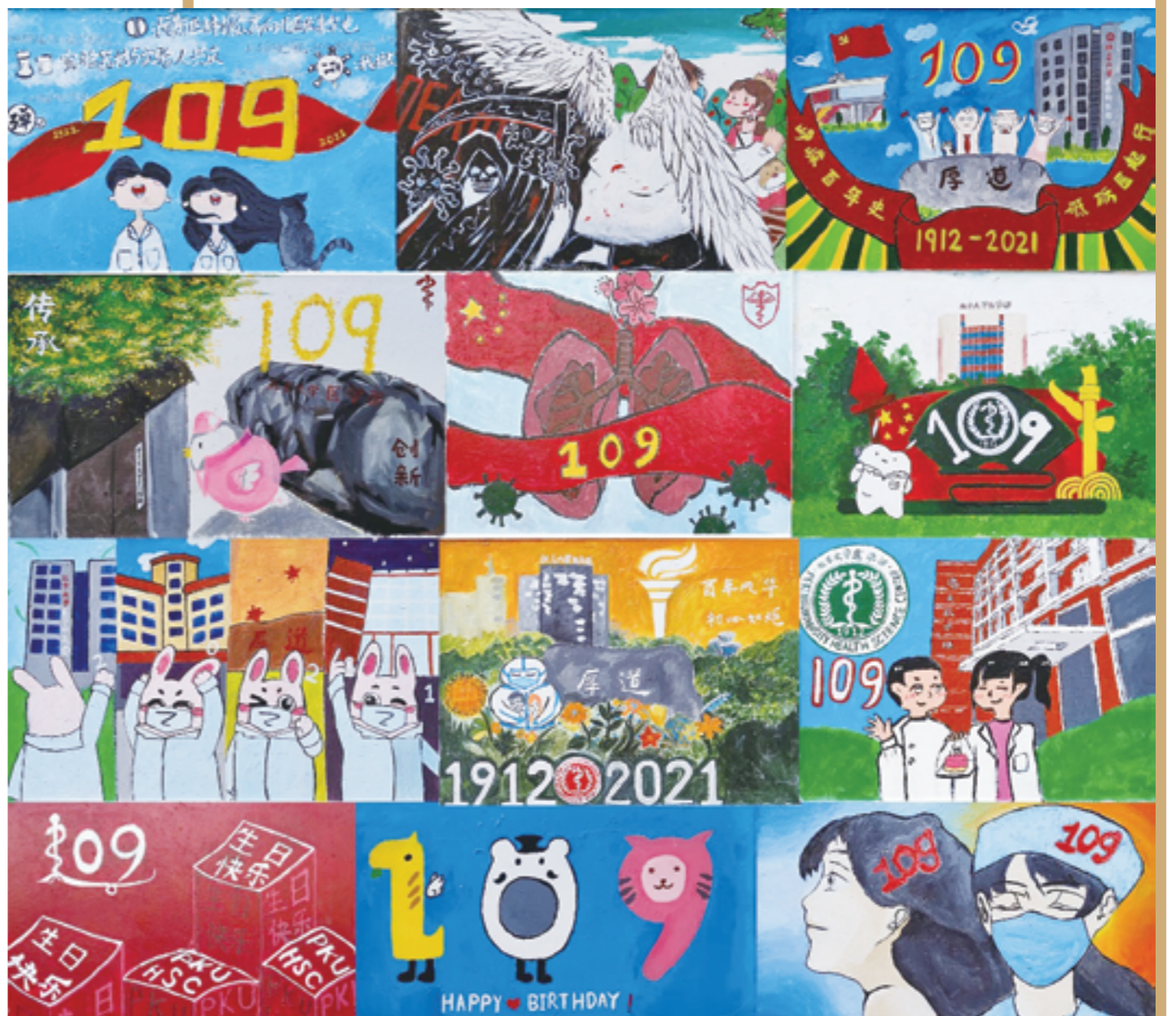
北医109周年生日涂鸦墙