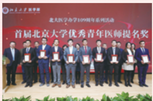
领导和嘉宾为优秀青年医师提名奖获得者颁奖