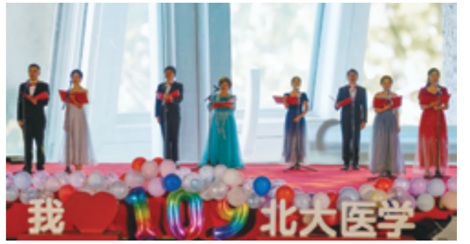
王晨一等《诵历史篇章，书北医荣光》