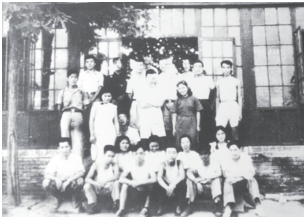
1948年夏，参加什坊院保健院的部分同志合影

如，在太平桥发现了10名天花病人，立即为他们进行了种痘工作；在一所小学中发现大部分孩子都有蛔虫，经治疗后每人排出二三十条以上的虫子。此外，保健院还为附近村民开办了儿童识字班，还从联合国救济总署争取了奶粉、布匹、毯子、棉衣等物资，发放给困难群众。随着工作的不断推进，保健院逐渐开设了门诊部、卫生教育宣传部、调查研究部、防疫保健部……真可谓“麻雀虽小五脏俱全”！