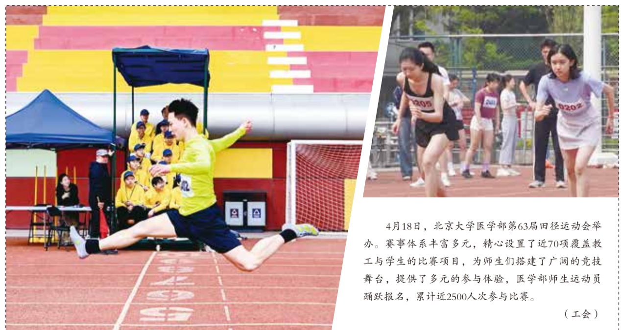
4月18日，北京大学医学部第63届田径运动会举办。赛事体系丰富多元，精心设置了近70项覆盖教工与学生的比赛项目，为师生搭建了广阔的竞技舞台，提供了多元的参与体验，医学部师生运动员踊跃报名，累计近2500人次参与比赛。